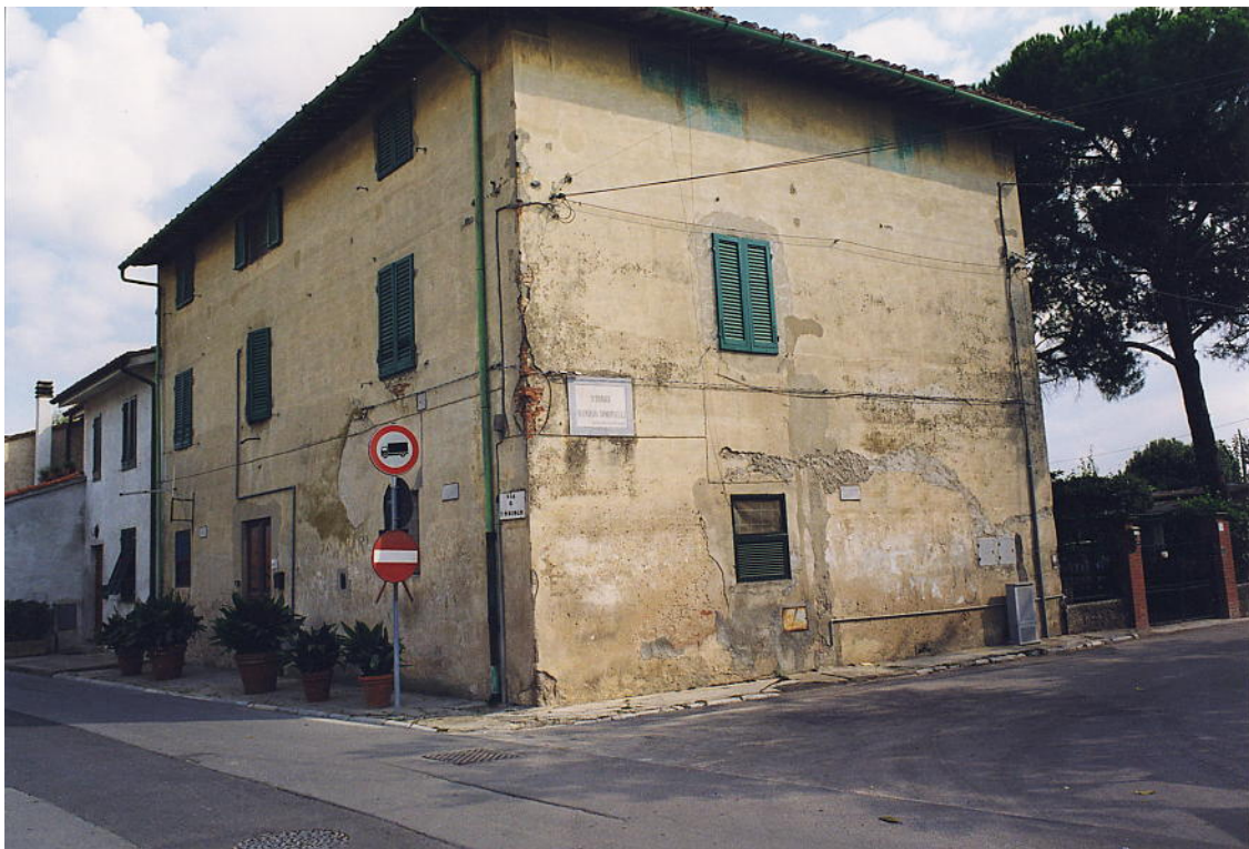
documentazione fotografica al settembre 1999