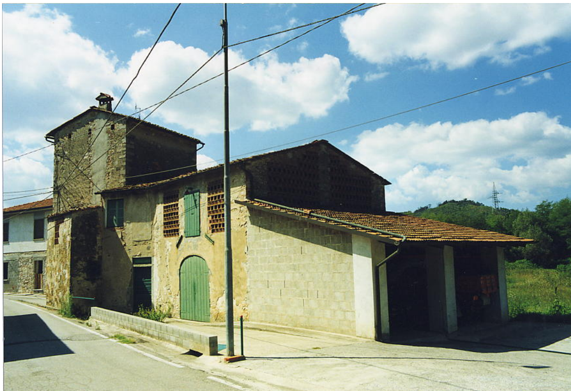
documentazione fotografica al settembre 1999