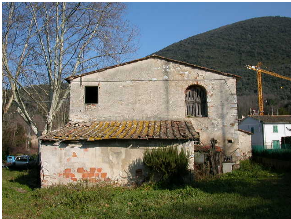
documentazione fotografica al gennaio 2003