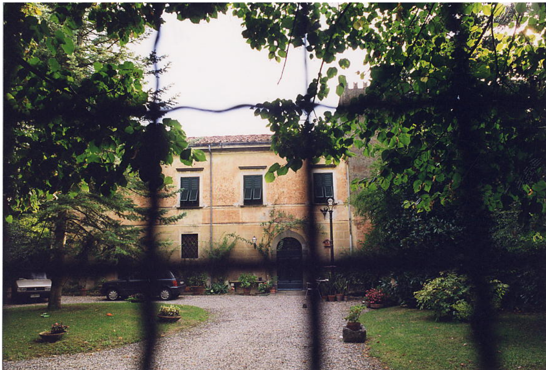
documentazione fotografica al settembre 1999