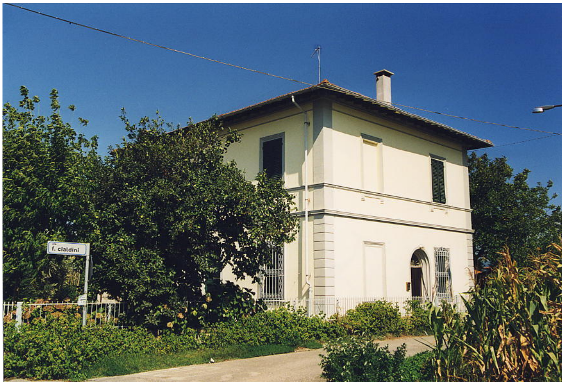
documentazione fotografica al settembre 1999