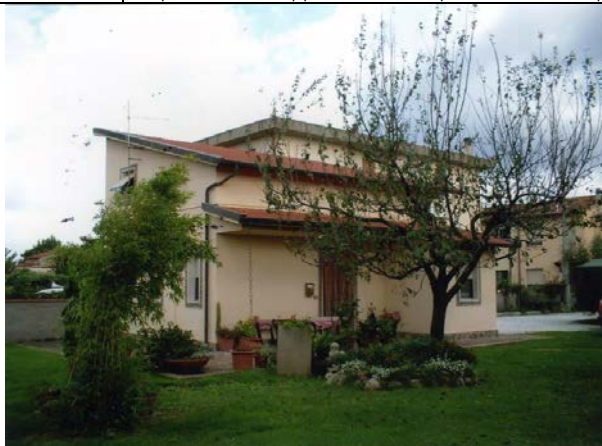
documentazione fotografica al febbraio 2005