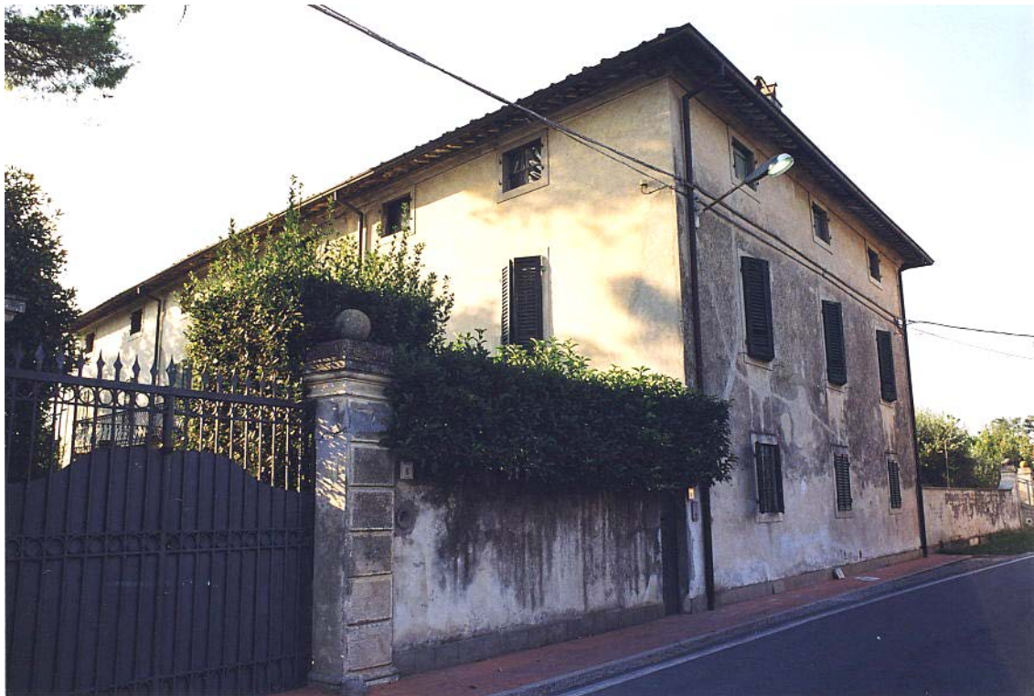
documentazione fotografica al settembre 1999