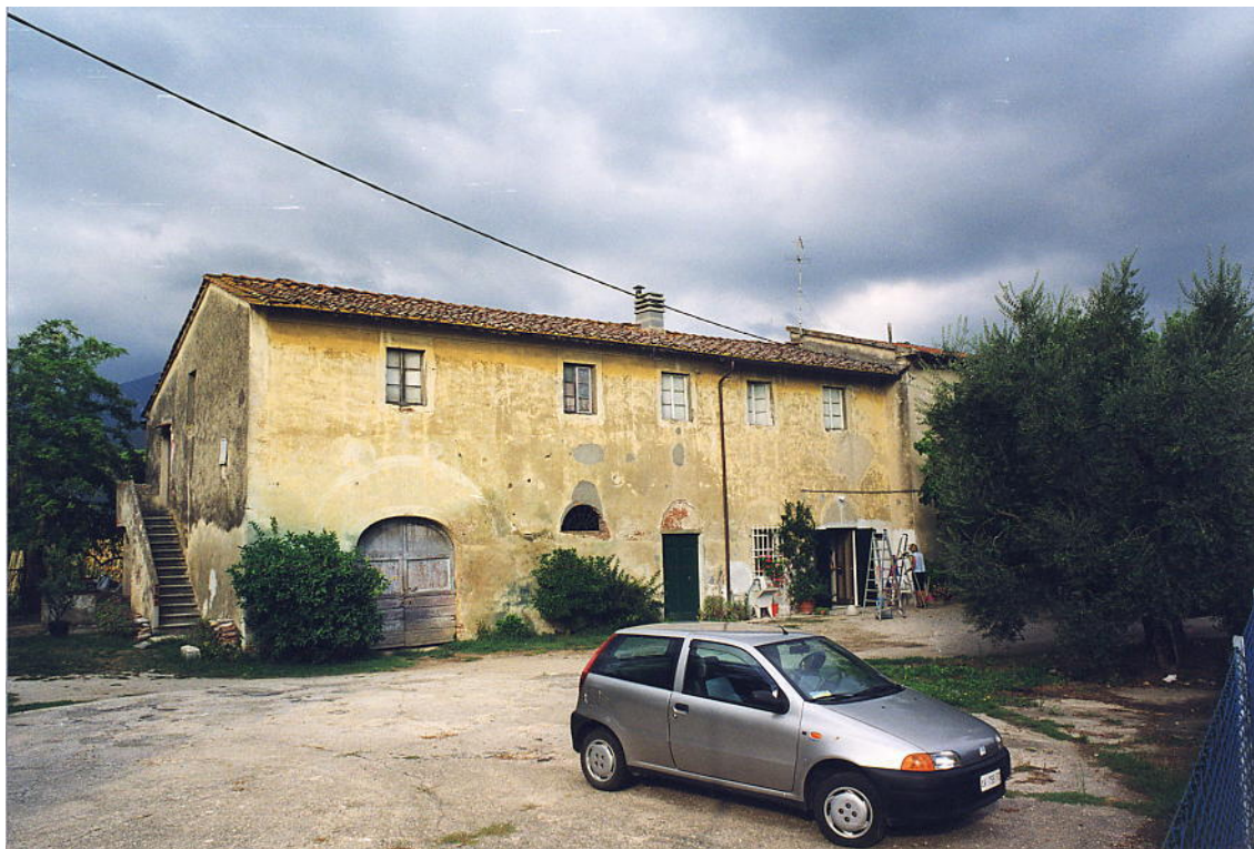
documentazione fotografica al settembre 1999