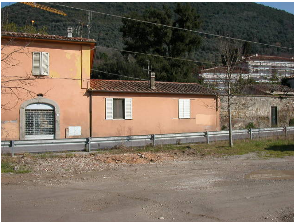
documentazione fotografica al gennaio 2003