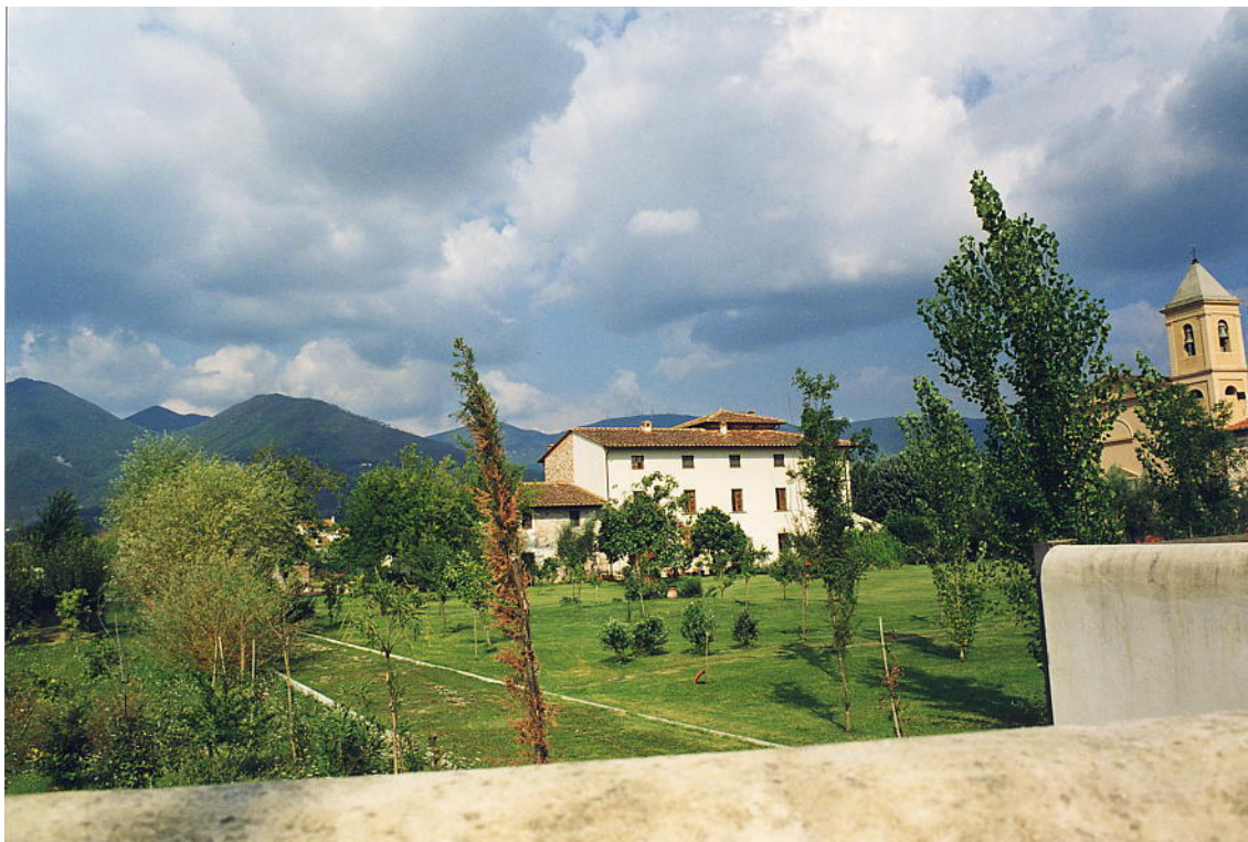
documentazione fotografica al settembre 1999