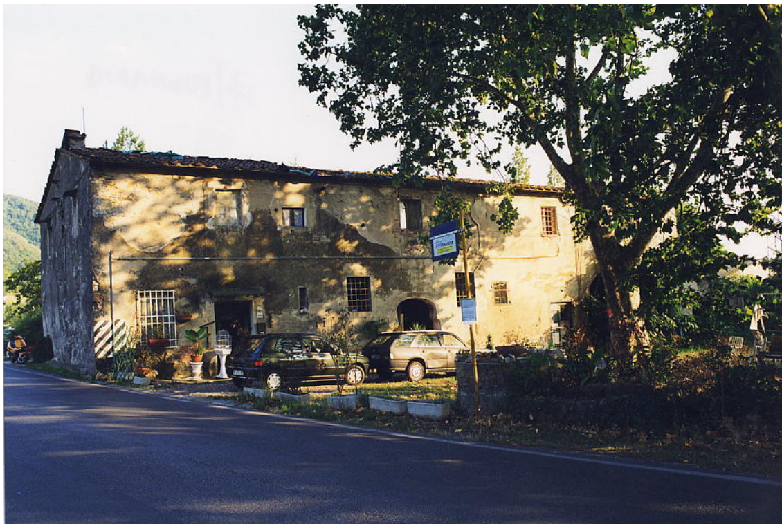
documentazione fotografica al settembre 1999