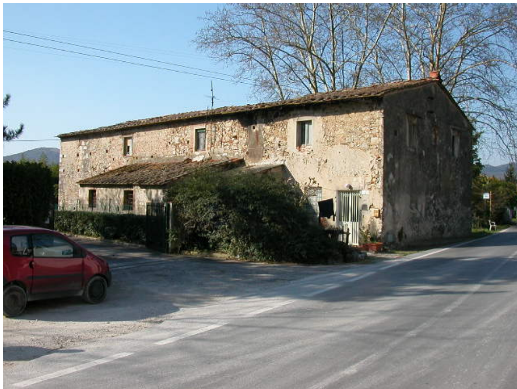
documentazione fotografica al gennaio 2003