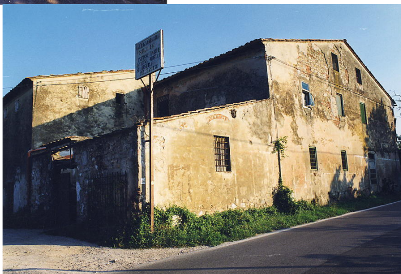
documentazione fotografica al settembre 1999