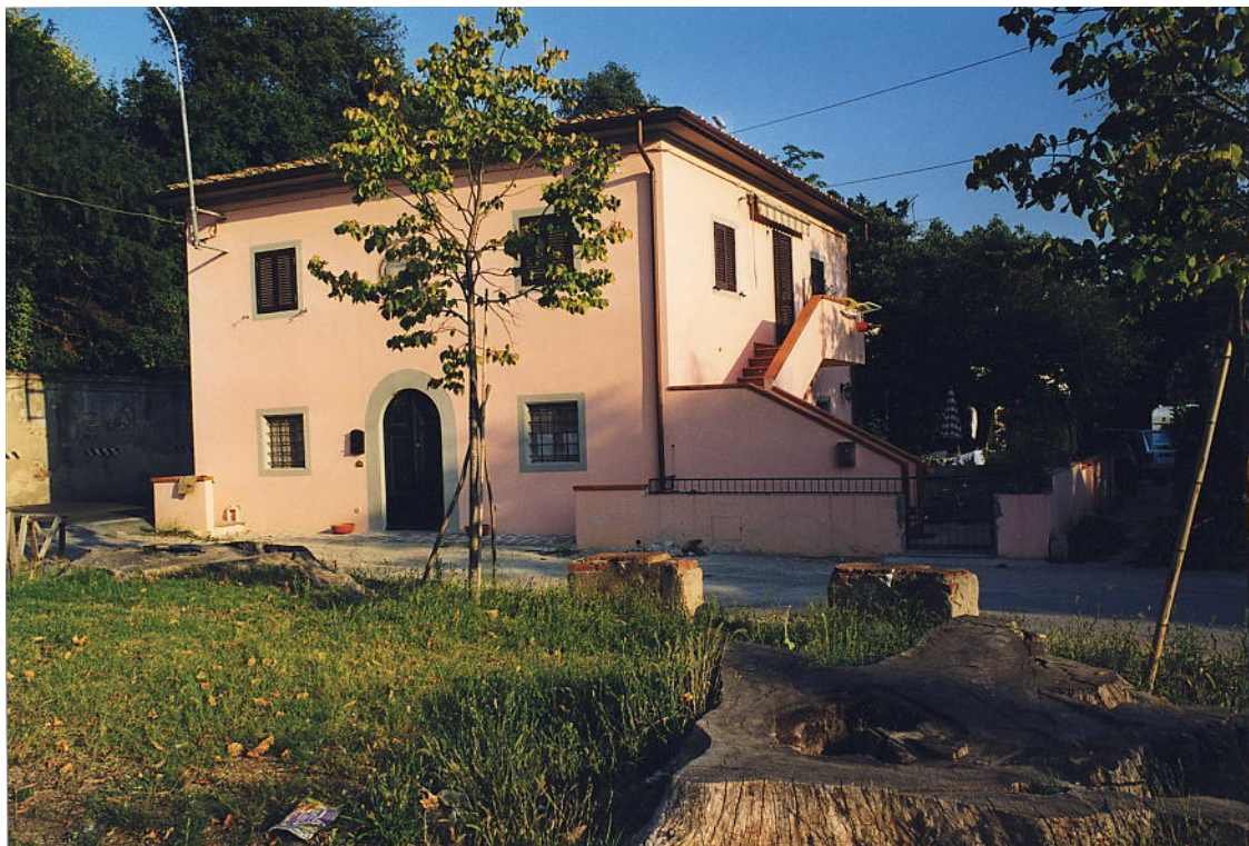
documentazione fotografica al settembre 1999