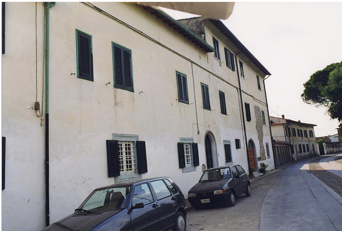
documentazione fotografica al settembre 1999