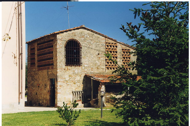
documentazione fotografica al settembre 1999