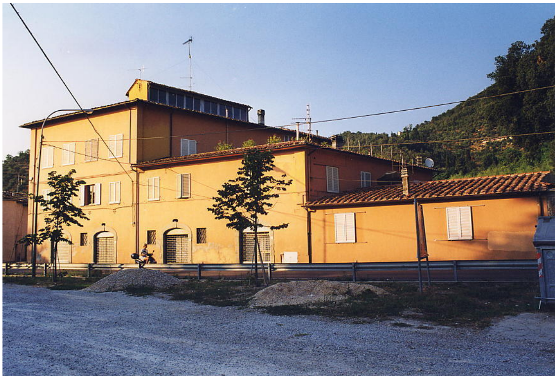
documentazione fotografica al settembre 1999