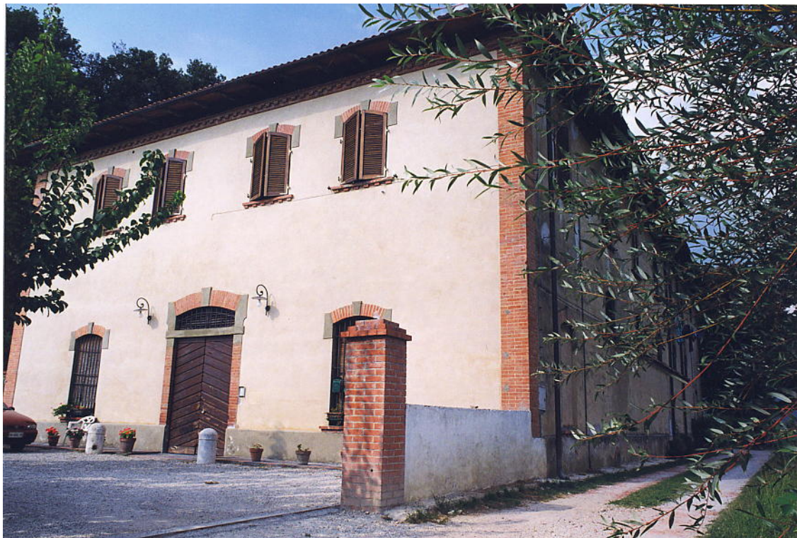
documentazione fotografica al settembre 1999