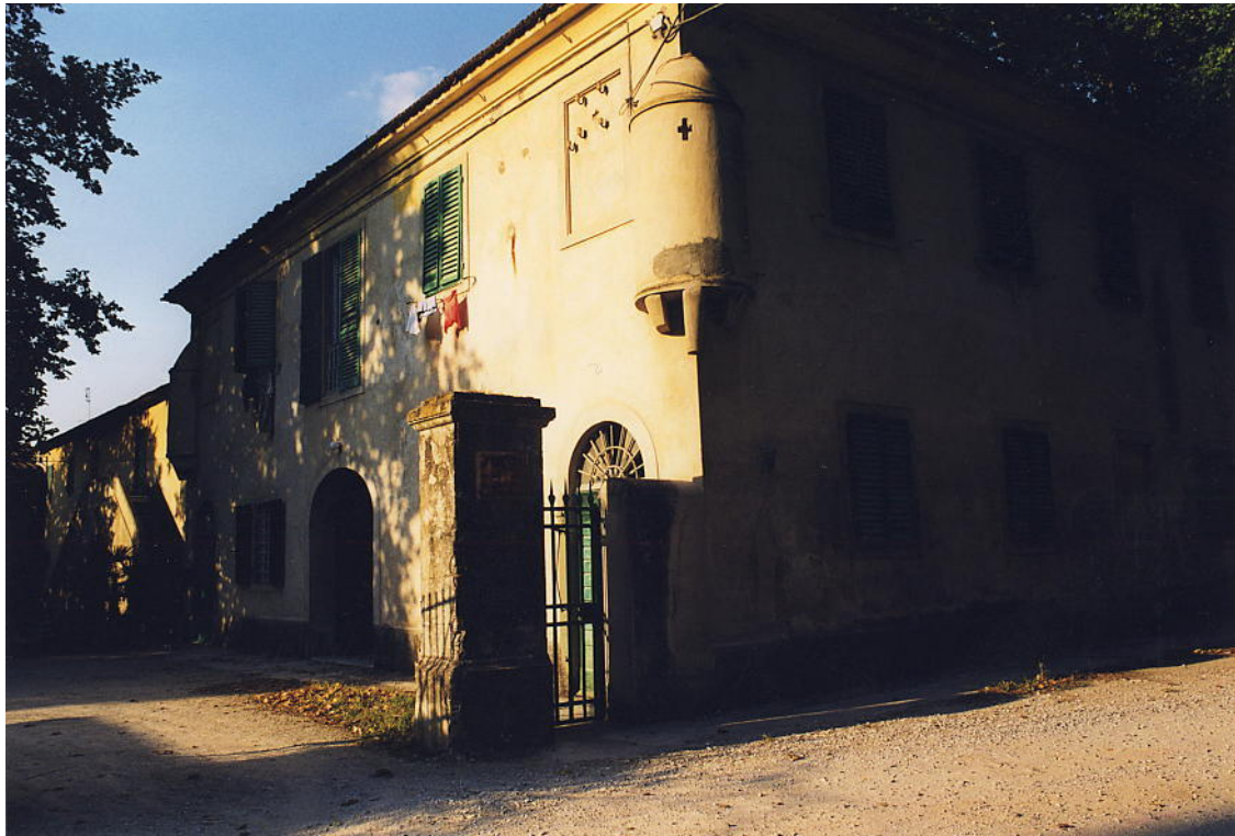
documentazione fotografica al settembre 1999