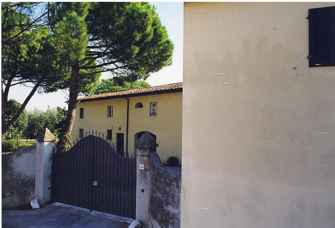
documentazione fotografica al settembre 1999