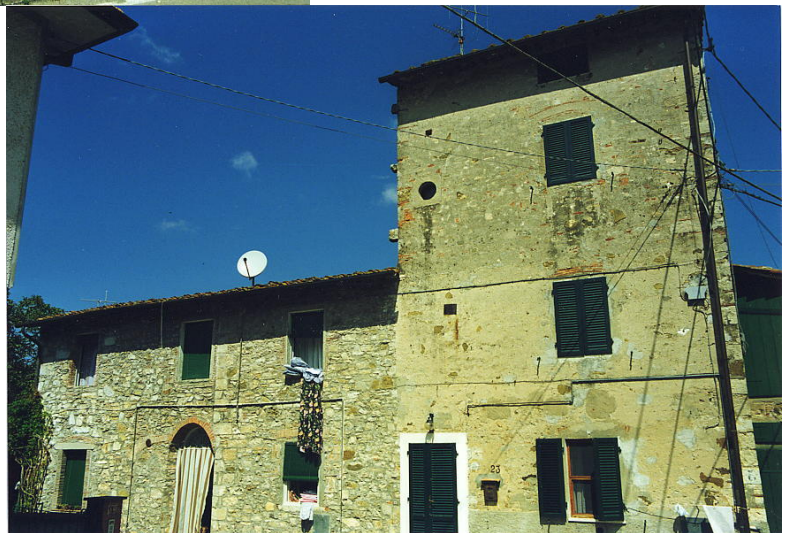
documentazione fotografica al settembre 1999