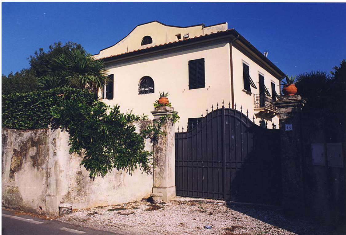
documentazione fotografica al settembre 1999