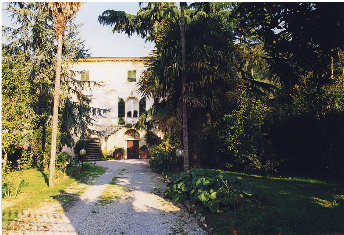
documentazione fotografica al settembre 1999