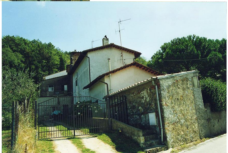
documentazione fotografica al settembre 1999